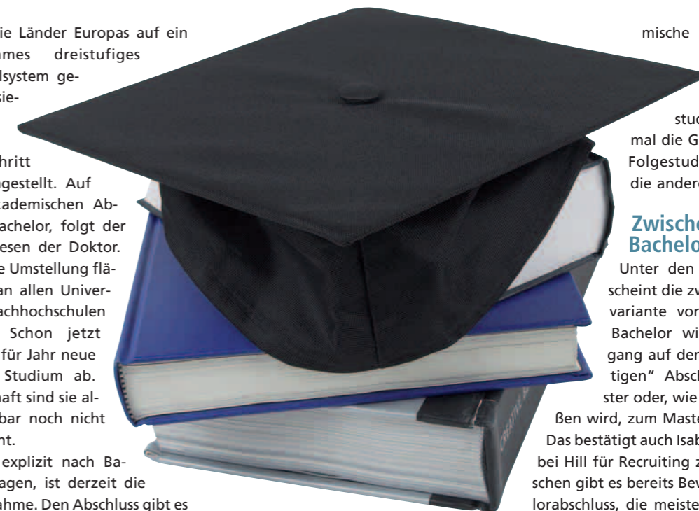
Bachelor als Zwischenschritt auf dem Weg zum Master

Zwar gibt der Bologna-Prozess ein europaweites dreistufiges Studiensystem vor, wie aber innerhalb dieses Systems der Bachelor definiert wird, bleibt weitgehend den einzelnen Staaten bzw. Ausbildungsstätten überlassen. Und so stoßen bei der Errichtung von Bachelor-Studien recht unterschiedliche Vorstellungen darüber aufeinander, was ein Bachelor können soll. Primär als eine praxisorientierte akade-